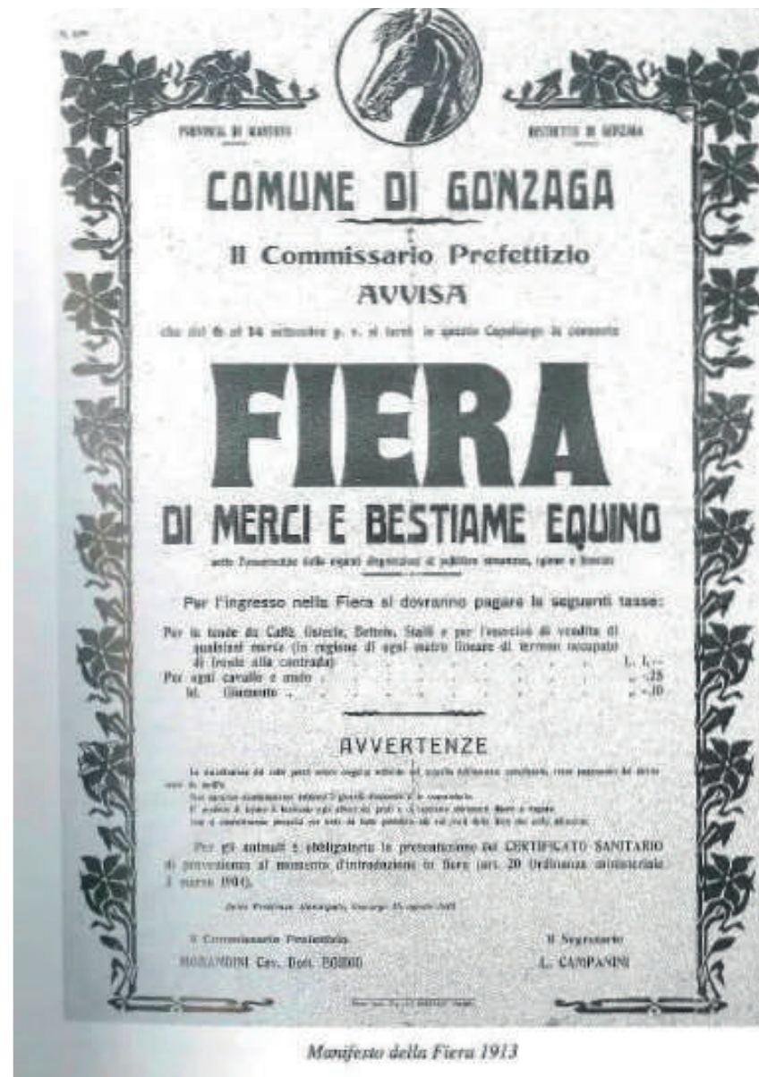
Manifesto della Fiera 1913